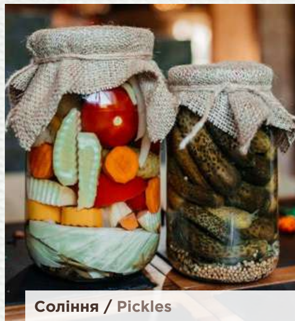
Соління / Pickles