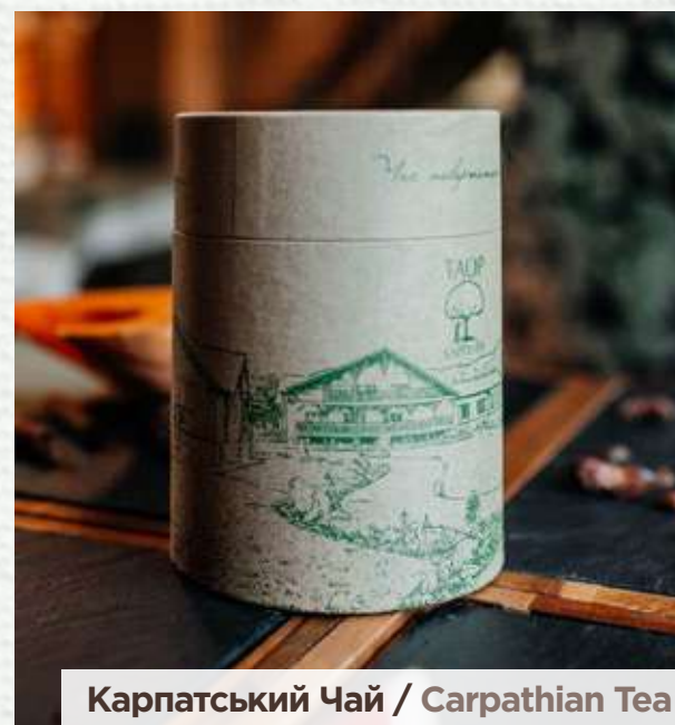
Карпатський Чай / Carpathian Tea