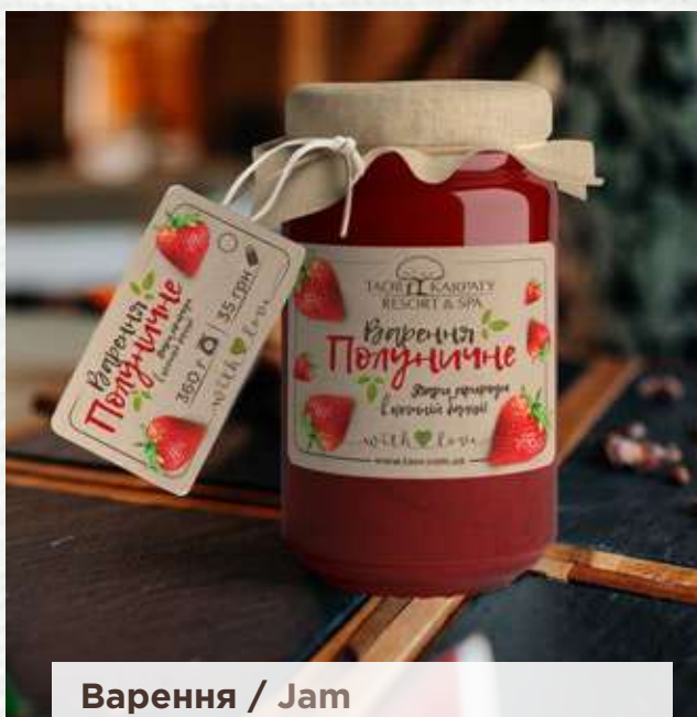
Варення / Jam