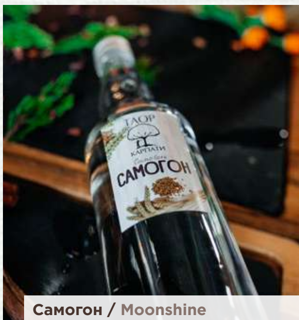
Самогон / Moonshine