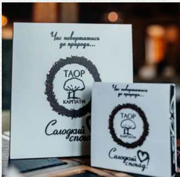
Цукерки TAOR / TAOR Sweets

Дари природи від TAOR Karpaty для Тебе Nature's gifts for You from TAOR Karpaty