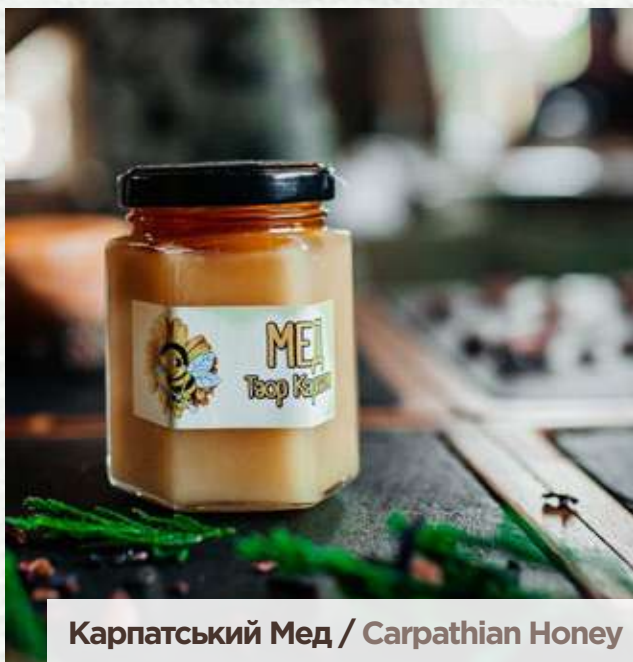
Карпатський Мед / Carpathian Honey

Дари природи від TAOR Karpaty для Тебе Nature's gifts for You from TAOR Karpaty