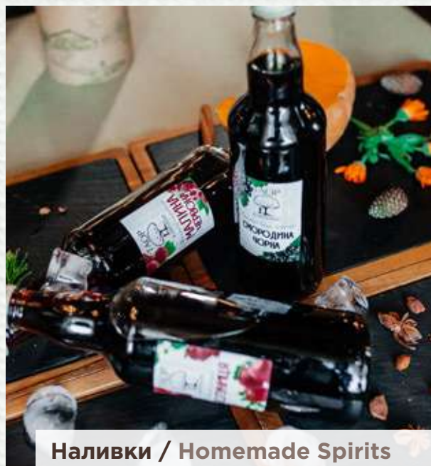
Наливки / Homemade Spirits

1 коробка / 1 box 100 g € 60.00 220 g € 170.00